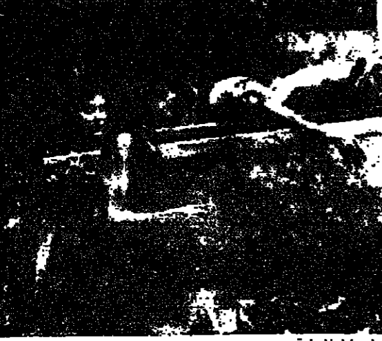
نقل احد ضحايا المجاعة